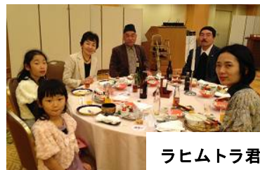
ラヒムトラ君ファミリー