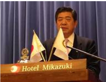
◇古川前会長の乾杯で...