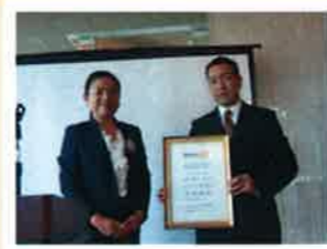
会長より会員バッジ・4つのテスト授与