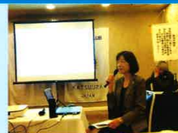
講師 漆原クラブ研修委員