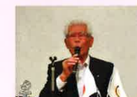
締め (岩瀬クラブアドバイザー)