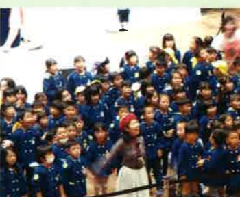
保育園児 “とても楽しそうで、とてもいい笑顔でした。”