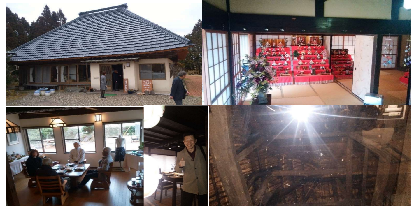
こちらで昼食をいただきました。