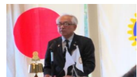
*千葉社会奉仕委員会会長